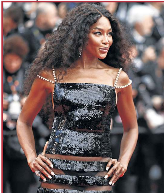
Naomi Campbell apostou em um look natural tanto na make quanto nos cabelos, valorizando a sua beleza

O gloss apareceu tanto nos lábios mais coloridos quanto nos mais discretos, que não eram tão discretos assim, uma vez que o brilho os fazia se destacar mesmo nas cores nude. A pele se manteve muito semelhante na maioria dos