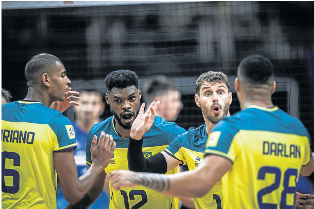
Seleção masculina penou, mas contou com a raça para encontrar o caminho da virada diante da Argentina

fundamentais. Os heranos protagonizavam papel de carascos no retrospecto recente. Conquistaram a medalha de bronze contra o Brasil nos Jogos de Tóquio-2024 e impuseram a primeira perda de título do país no Sul-Americano no ano passado. No reencontro no Maracanãzinho, o Brasil começou o jogo muito bem e venceu o primeiro set por sonoros 25 x 13. O desempenho, no entanto, não traduzia a dificuldade a seguir. Os argentinos melhoraram e ganharam as duas parciais seguintes: 25 x 20 e 25 x 19. Os brasileiros resurgiram e empataram com um 25 x 23 sofrido. No tie-break, a torcida fez a