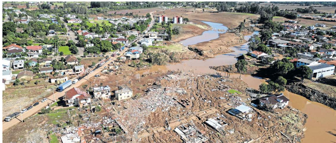
A linha de crédito para reconstrução deve contar, também, com recursos oferecidos por instituições estrangeiras

Será destinada a pessoas jurídicas e a governos municipais, destacou o executivo. “A demanda vem de entes públicos, como também para pequenas e médias empresas e para a reconstrução de infraestrutura.”