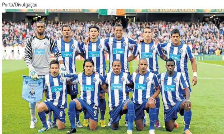
Porto encantou Portugal com o elenco de 2010/2011 (foto) e 2012/2013