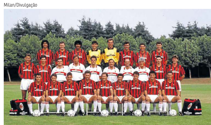
Milan de 1991/1992 tinha lendas, como Gullit, Baresi, Maldini e Van Basten