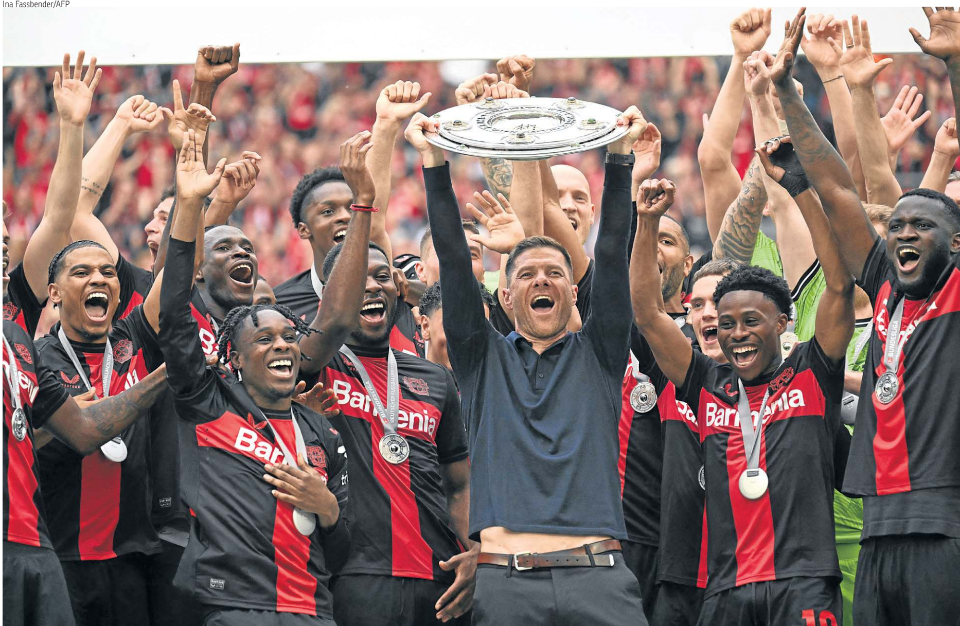
O técnico Xabi Alonso e o Bayer Leverkusen ergueram a salva de prata com 17 pontos de vantagem para o vice-líder Stuttgart. De brinde, ganharam a vaga direta na próxima Liga dos Campeões

O fenômeno da invencibilidade passou pela Itália em duas oportunidades. A primeira, na