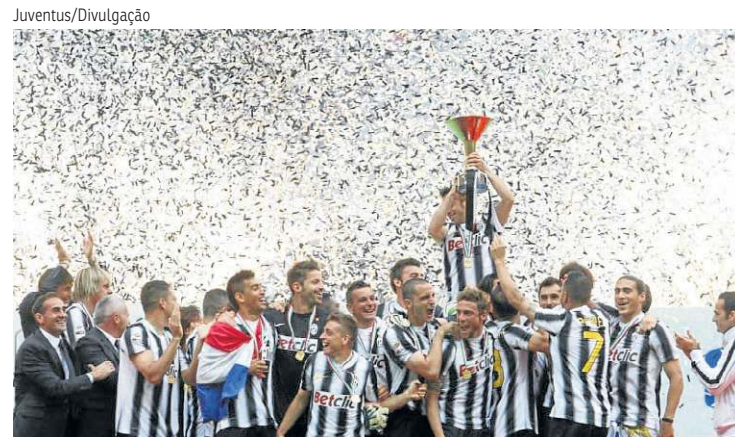
Maior campeã italiana, a Juventus (36) foi a mais regular em 2011/2012