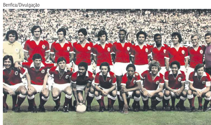
Benfica de Eusébio foi o primeiro campeão português invicto em 1972/1973