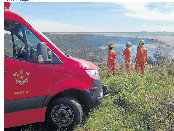
Corpo queimado de homem foi encontrado na região do Tororó