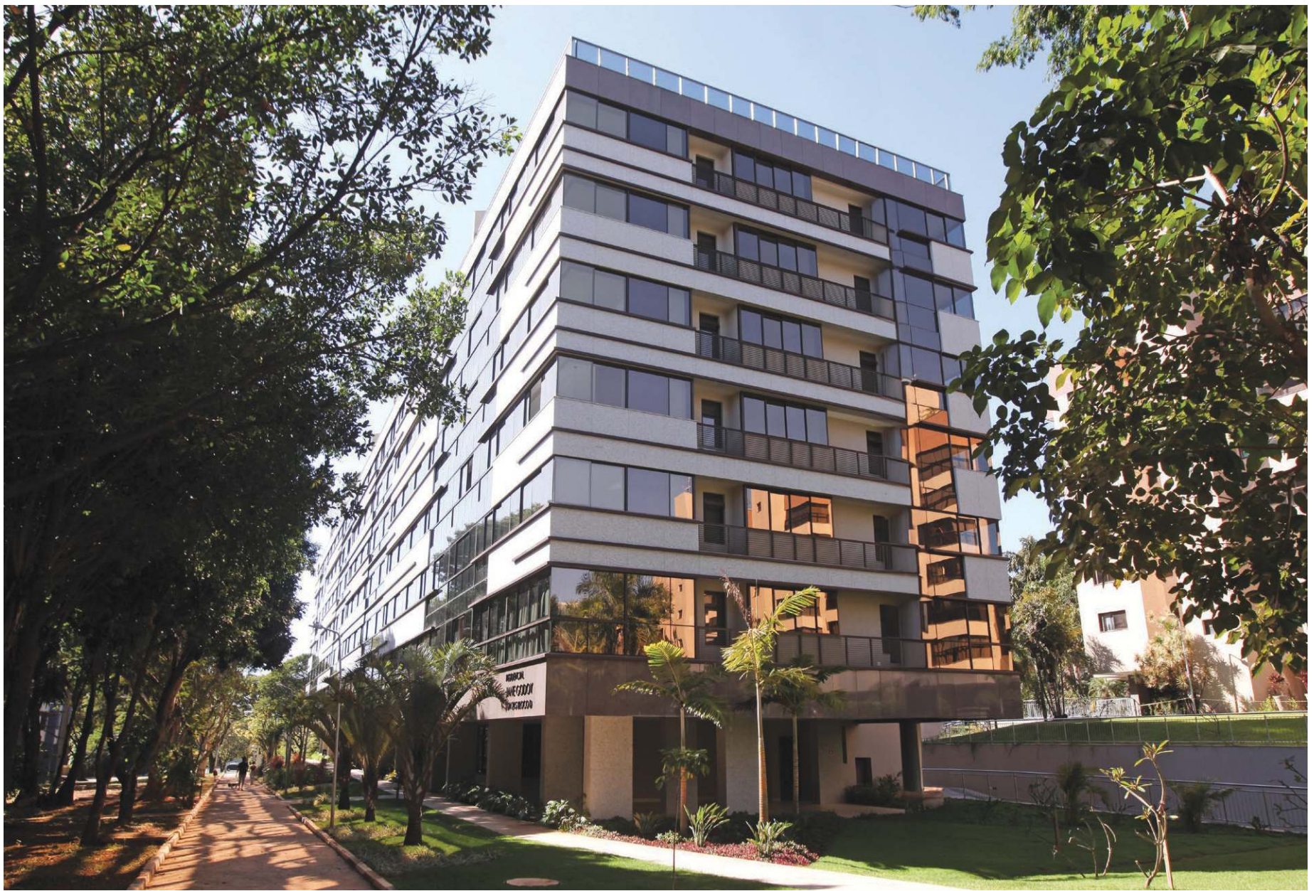
2º Ofício R14 M.4589