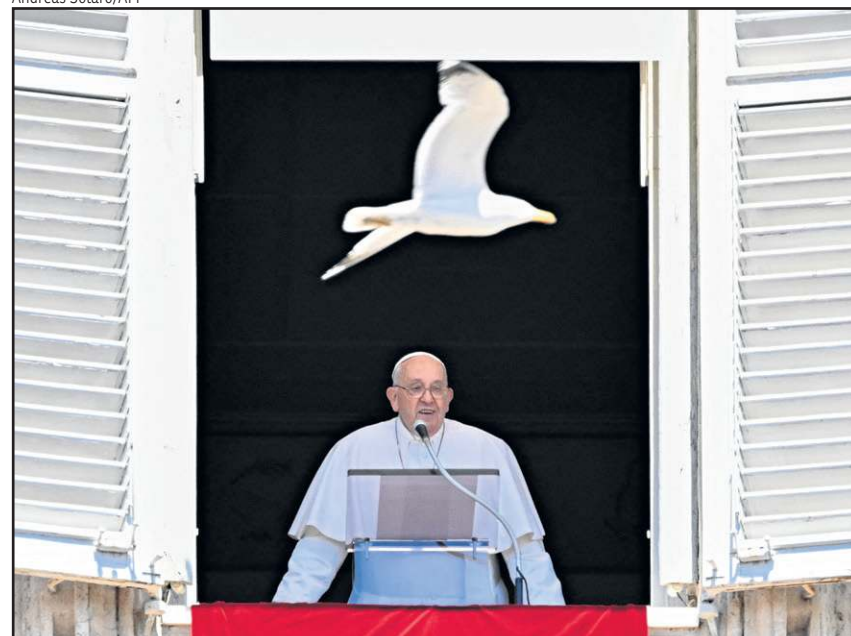
Papa Francisco no Vaticano: "Que o Senhor conforte os familiares"