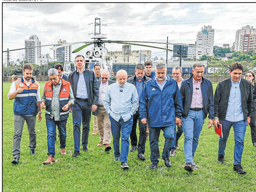
Lula lidera comitiva de autoridades: orçamento de guerra para o Sul