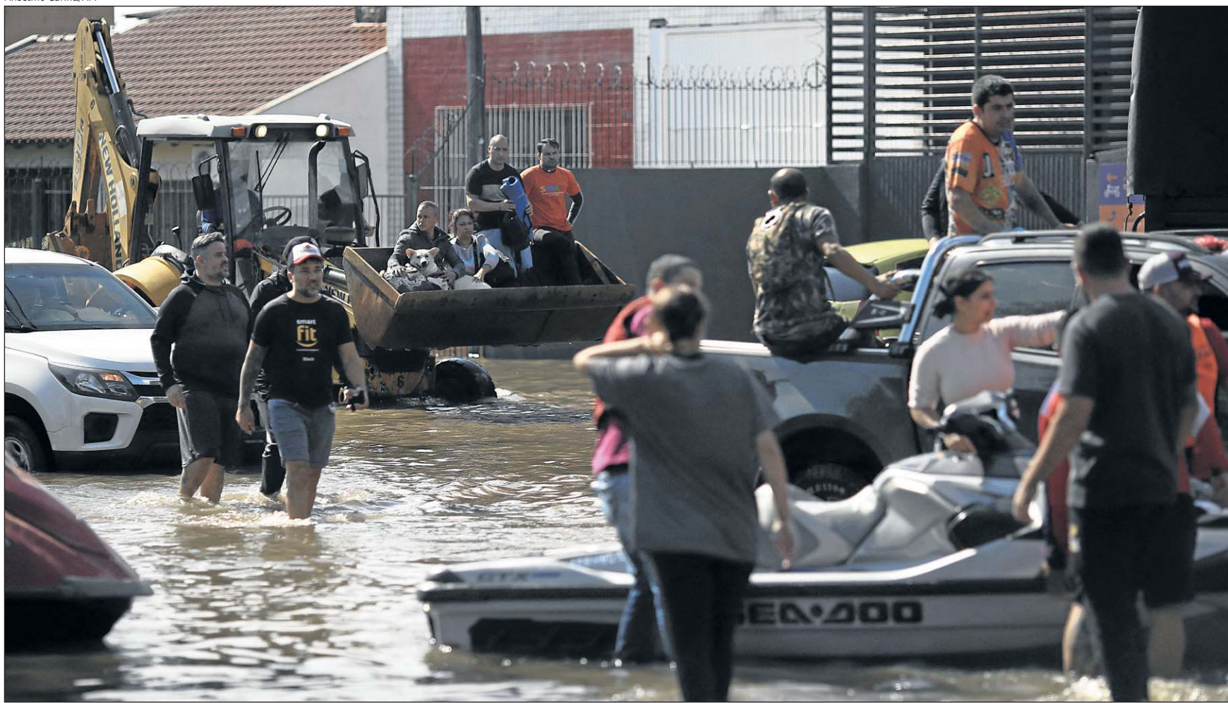
No bairro de Sarandi, em Porto Alegre, equipes de resgate e voluntários usam retroscavadeira (ao fundo) e jet ski para salvar vítimas: 78 mortos

● Governador faz apelo: "Não é hora de procurar culpados"