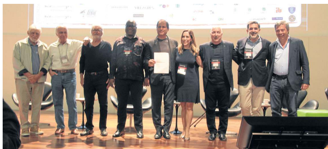
Pela primeira vez, encontro é realizado em Brasília, palco das mais emblemáticas obras de Oscar Niemeyer

Esta é a primeira vez que o fórum é realizado em Brasília, capital que é berço dos mais emblemáticos monumentos do arquiteto modernista. O tema central nesta edição é A revolução pós — Desafios e metas para um mundo sustentável. A 4ª edição do Fórum