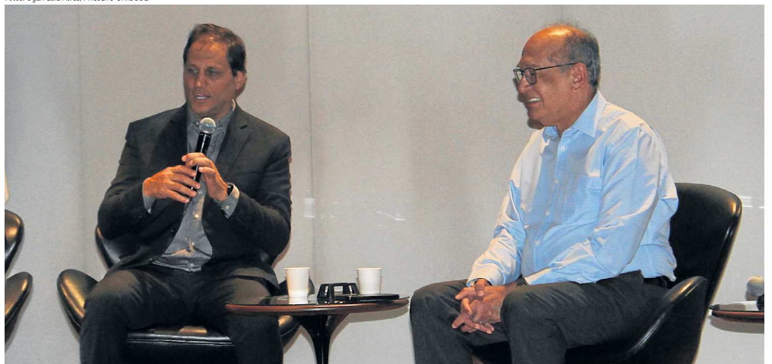
O ministro do STF Gilmar Mendes (D), ao lado de Paulo Niemeyer, comemorou a relevância de reunir profissionais pelo desenvolvimento urbano