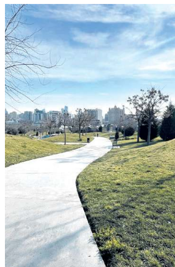
Baku tem mais de uma dezena de parques urbanos