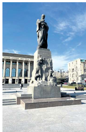
A capital do Azerbaijão tem dezenas de monumentos em homenagem a líderes do país