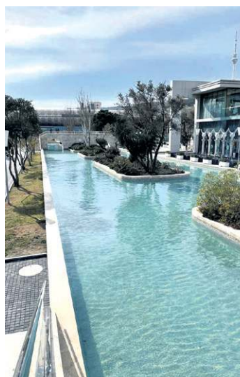
Uma réplica de Veneza é um dos destaques do calçadão à beira-mar: ponto turístico