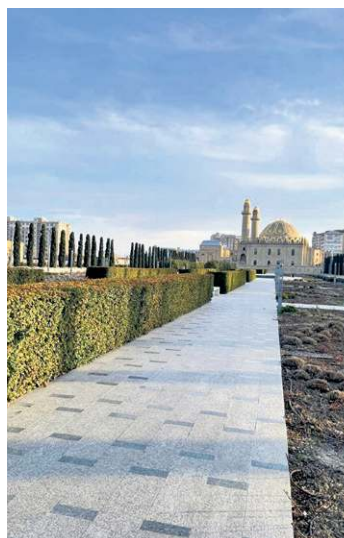
Mesquita em Baku: 85% da população é muçulmana