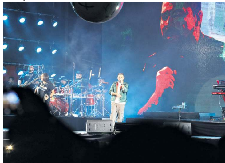
Show de forró animou o público que foi à Torre de TV na noite de ontem