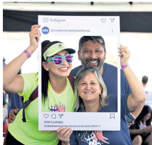
Equipe do Comercial prestigiou o evento

pontos turísticos locais, embelezando ainda mais o trajeto. Foi um exercício de superação pessoal e me senti muito bem ao terminar o percurso. A corrida acolhe a todos, de atletas a pessoas que, como eu, encontram nesses eventos a oportunidade de prática esportiva. Particparei anualmente, já é uma tradição”, afirmou.