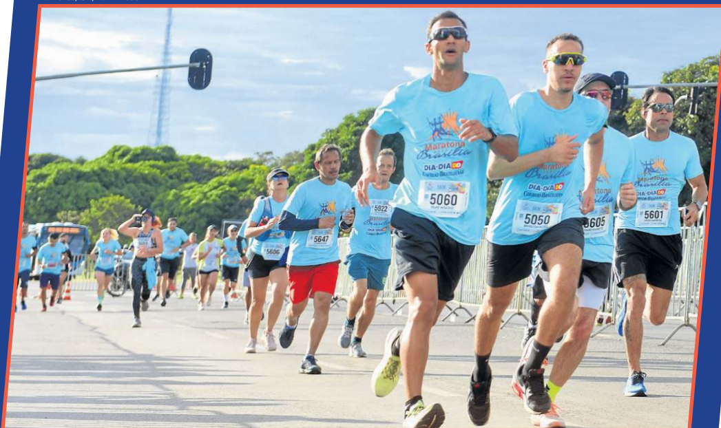
Sucesso em 2023, a Maratona Brasília, do Correio, vem com desafio duplo, amanhã e domingo