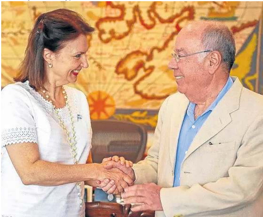
Mondino se reunirá com Vieira e empresários. Agenda deve ignorar as falas de provocação de Milei ao Brasil