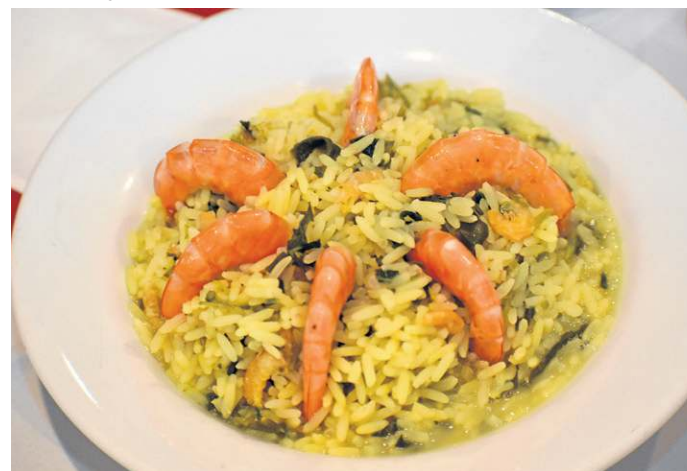
Arroz paraense, um dos destaques da casa Du Pará