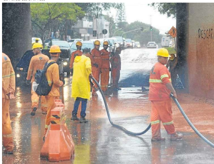
As chuvas causaram transtornos, ontem, na quadra 202 da Asa Norte