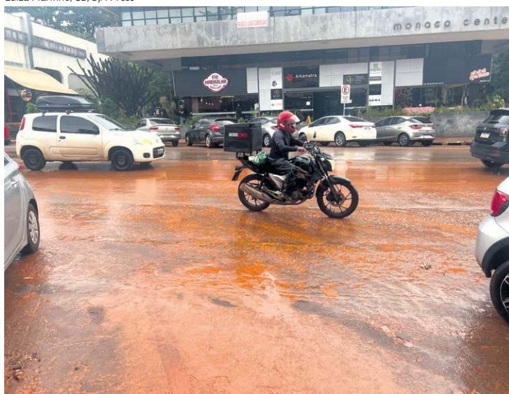
As ruas se tornaram cenários caóticos de alagamento e lama