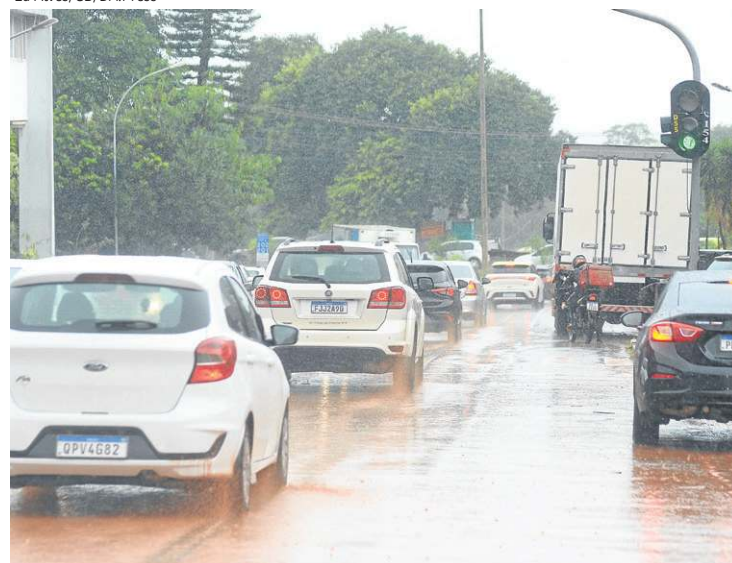
A previsão é de mais temporais até domingo, segundo meteorologia