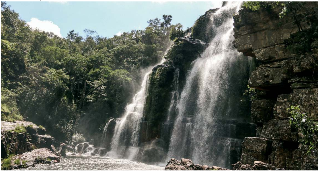
A Chapada dos Veadeiros é um dos destinos procurados pelos brasilienses

A poucos dias da Semana Santa, há quem busque aproveitar o feriado para descansar, passar um tempo com a família e, por que não, se divertir em destinos ainda não conhecidos. Outros optam por celebrar a data em procissões e encenações da Paixão de Cristo. Fato é que o período movimentou o setor de turismo, seja em localidades mais próximas ao Distrito Federal, seja em cidades famosas por receberem turistas durante o ano todo.