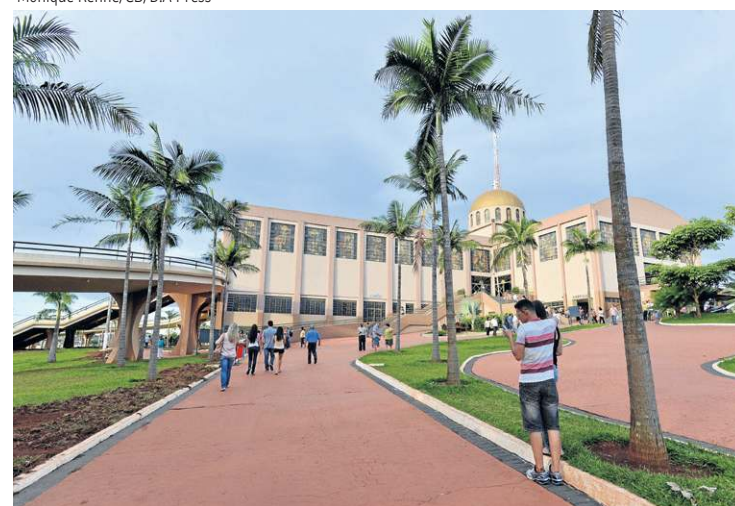
Fiéis vão à Trindade (GO) para ver a encenação da Paixão de Cristo