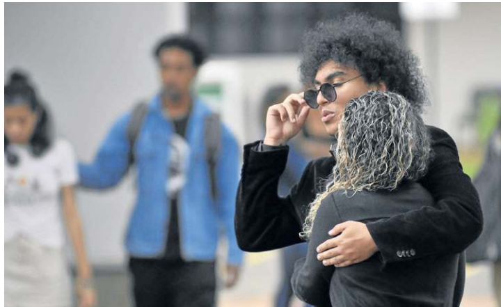
Colegas da UnB não se conformam com a morte precoce: "Covardia"

pessoas ou saliva. Pelos laudos, a polícia também espera saber a data aproximada da morte do estudante e a profundidade das lesões. "A primeira linha de investigação é a de homicídio, mas não descartamos outras hipóteses devido à superficialidade das lesões", disse o delegado.