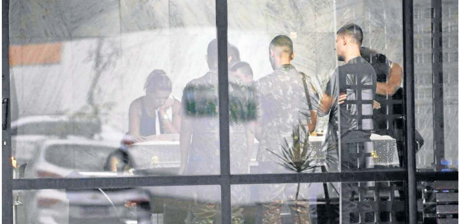
O corpo do universitário foi velado no Campo da Esperança da Asa Sul ontem à noite. Familiares e amigos estão em busca de respostas