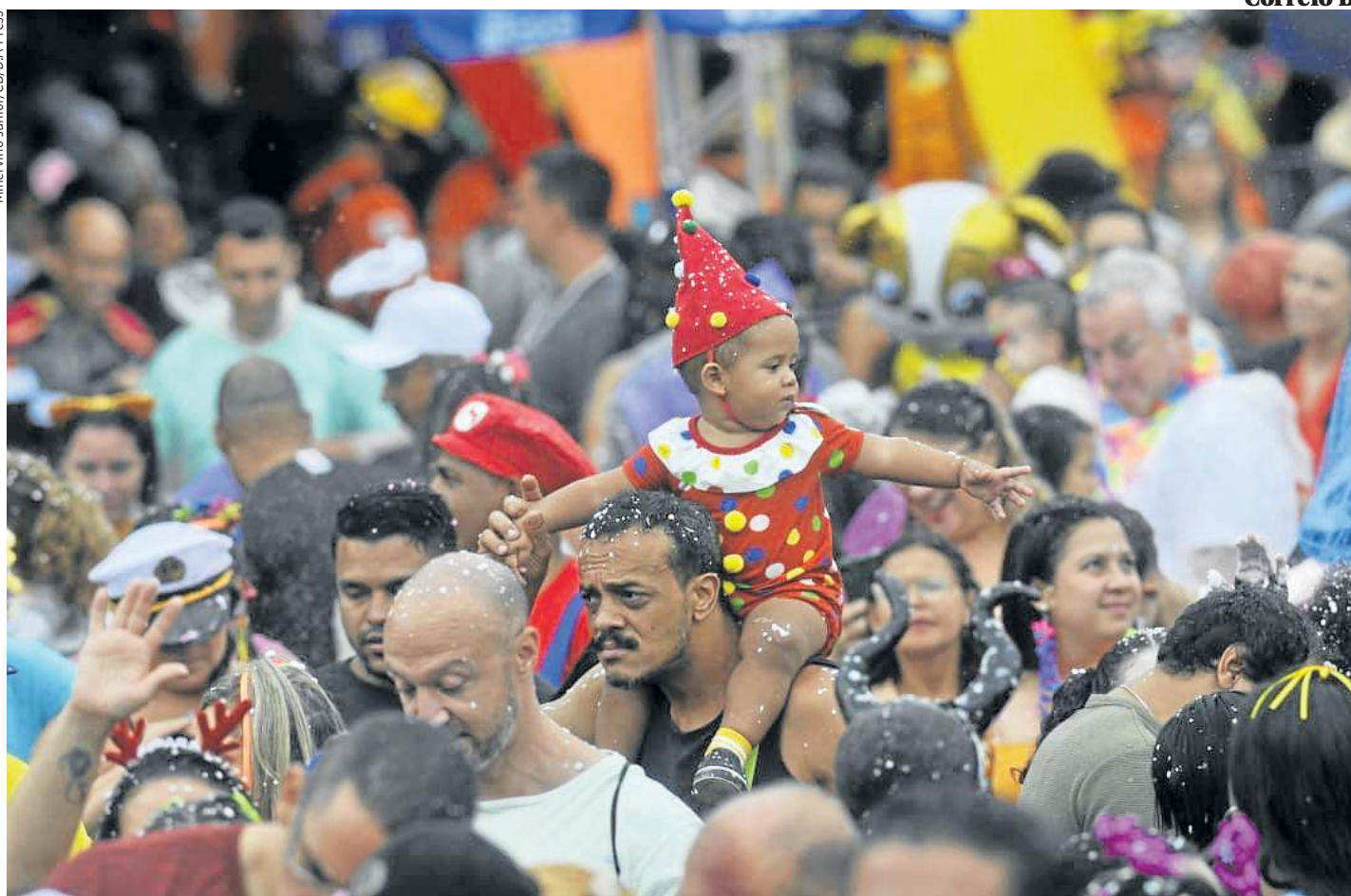
Nem mesmo o tempo chuvoso desanimou a criançada, que curtiu com os pais no bloco Baratinha, no Parque Ana Lúcia