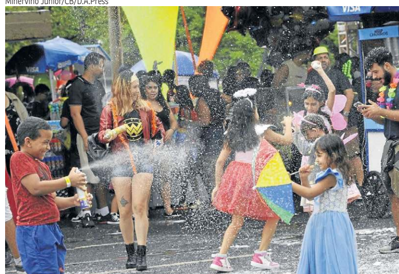
A espuminha foi brincadeira obrigatória para completar a diversão