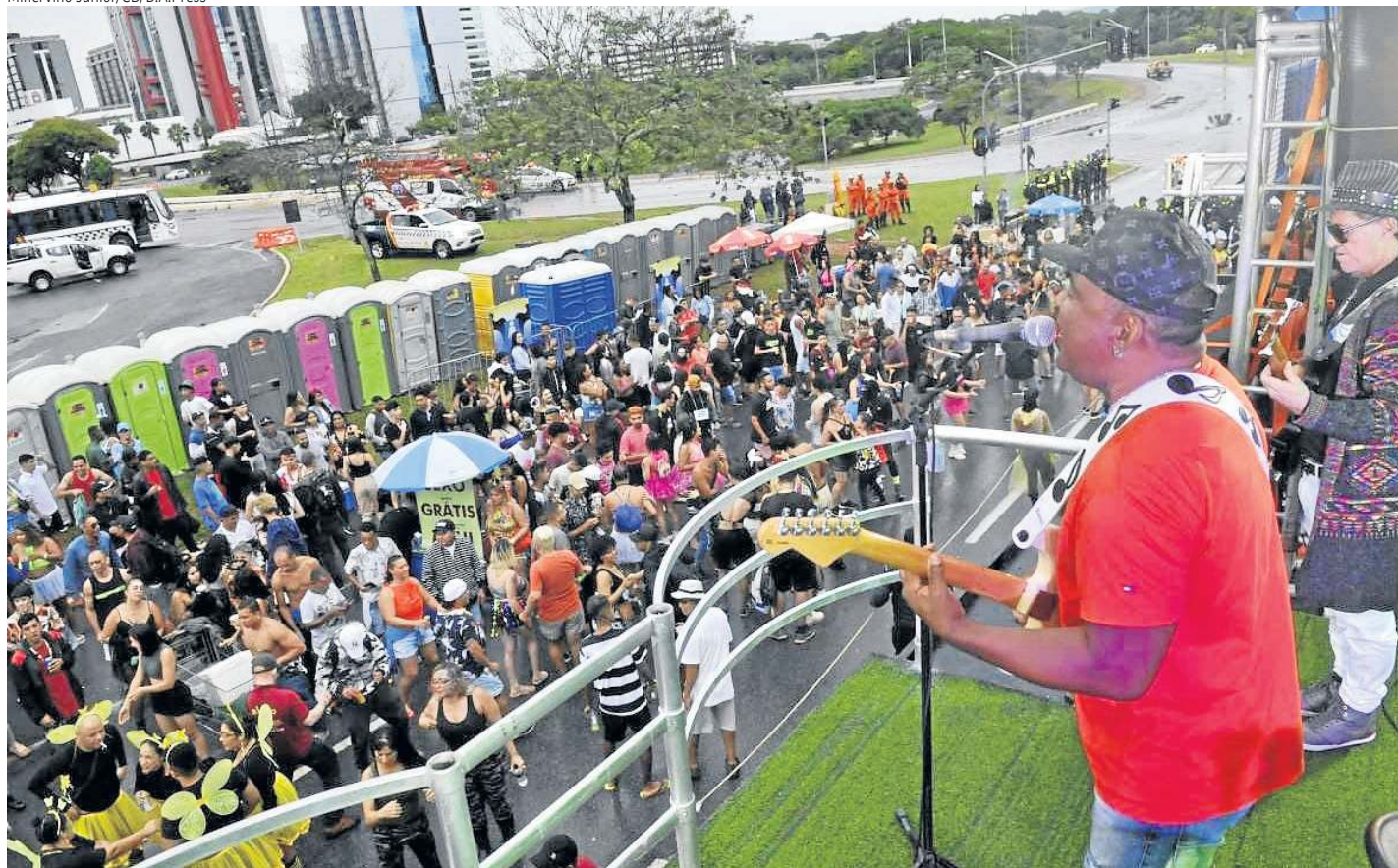
O bloco dos Reparigueiros estreou em um novo local, o Setor Bancário Norte (SBN), e, como sempre, atraiu muitos foliões