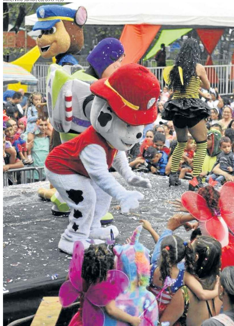
A Patrulha Canina caiu na folia e animou a festa para a garotada