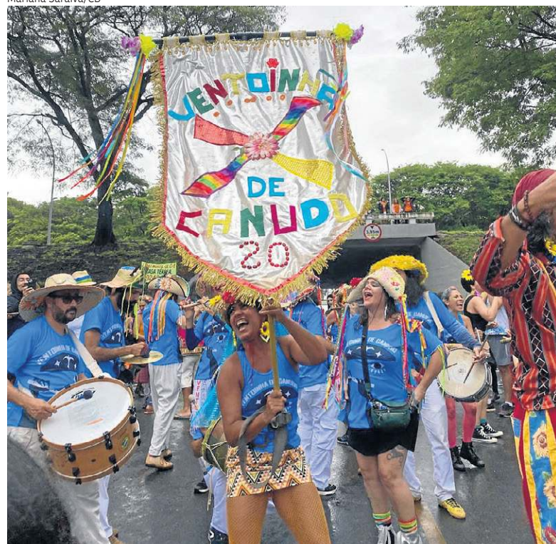
O bloco Ventoinha de Canudo reuniu gerações na 205/206 Norte