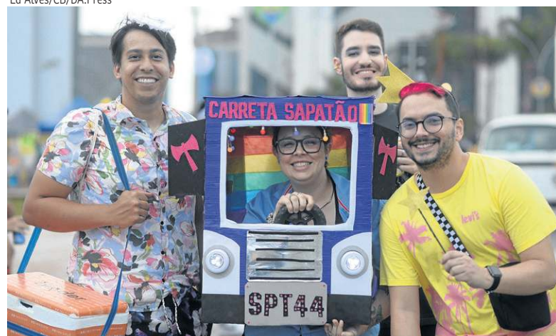
A criatividade e o bom-humor deram o tom ao bloco das Montadas