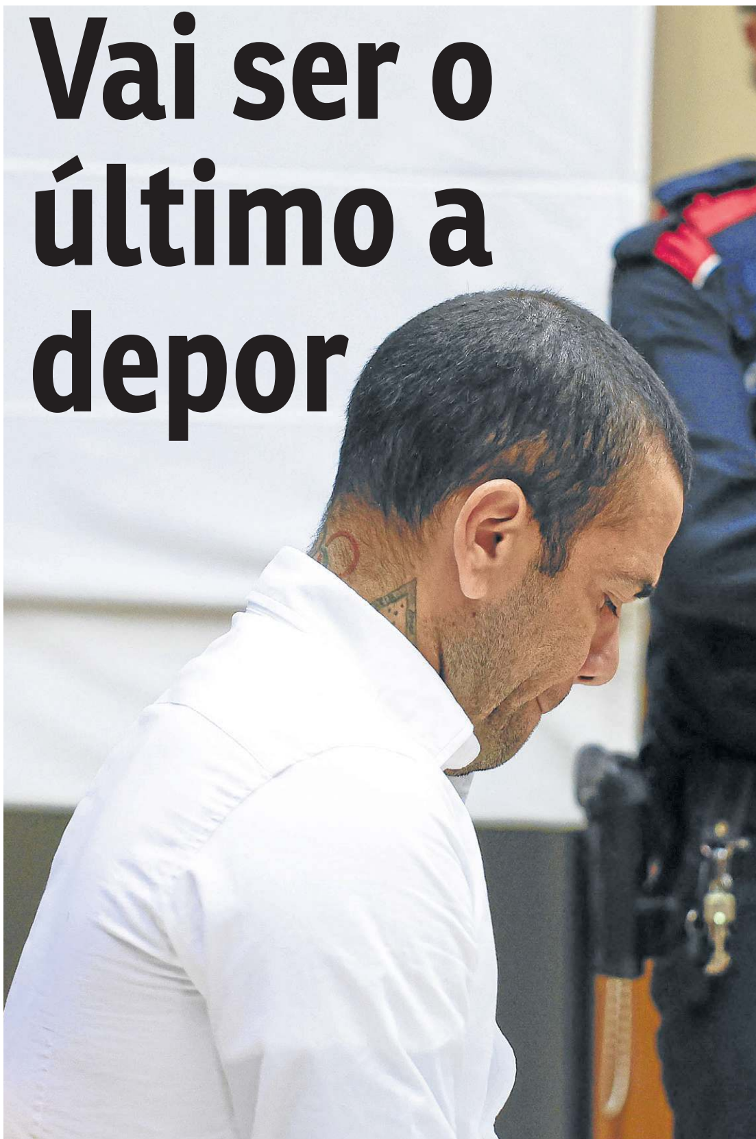
O jogador está preso na Catalunha há mais de 380 dias. Não há certeza se o veredicto sairá ao fim do julgamento

Após convidá-las para beber champanhe, o ex-lateral da Seleção Brasileira teria chamado a jovem para entrar em outra área exclusiva onde ficava o pequeno banheiro, o qual ela desconhecia. Segundo o MP, o ex-jogador do Barcelona teria demonstrado uma "atitude violenta", agredindo a mulher. Ela teria sido forçada a manter relações sexuais, apesar de sua resistência.