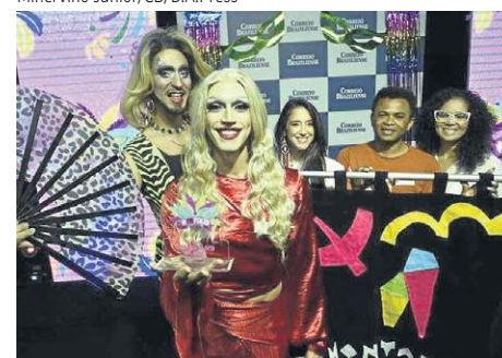
Bloco As Montadas levou o troféu CB.Folia do ano passado