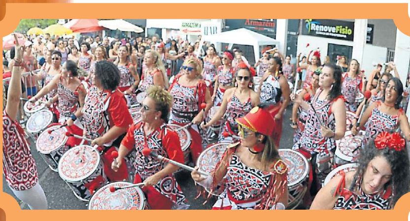
Grupo Batalá agitou a Entrequadra 205/206 Norte