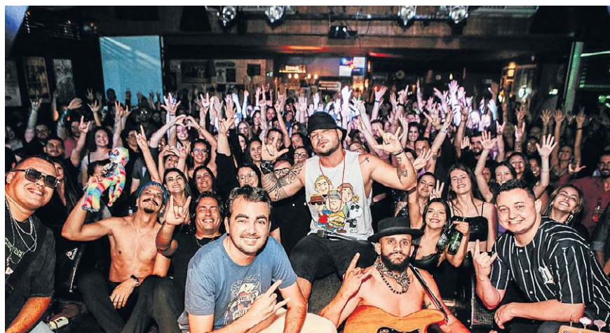
Bloco do Eu Sozinho se apresenta no O'Riley neste sábado

Urbana e outros gigantes da música nacional.