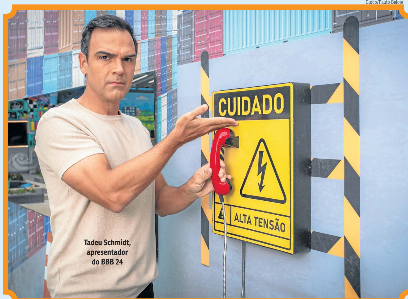
Tadeu Schmidt, apresentador do BBB 24

Nesta edição, uma das principais reclamações do público foi ouvida pela produção do programa. O BBB 24 contará com votação dividida em duas etapas — da torcida, que poderá ser feito de forma ilimitada, e único, que será garantido por meio do CPF. Cada modelo de votação terá o peso de 50% e o resultado final será a média ponderada dos dois formatos.