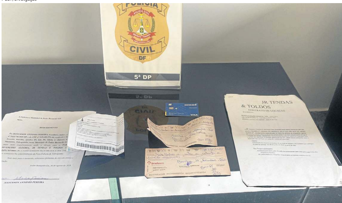
Documentos dos criminosos que aplicavam golpe do falso aluguel de tendas