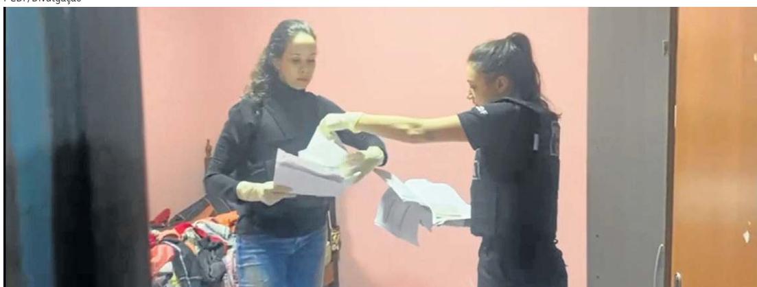
Policiais civis fazem busca e apreensão em residência de integrante do grupo

serviços de locação de tendas e equipamentos para eventos por meio dos sites das empresas. Após serem contatados pelos interessados, os integrantes