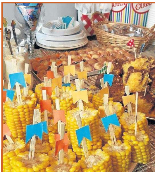
O tradicional milho pode estar na mesa posta com outros acessórios juninos