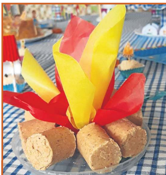
Na mesa posta, estampa com acessórios juninos ajuda a ornamentar com ousadia as deliciosas comidas