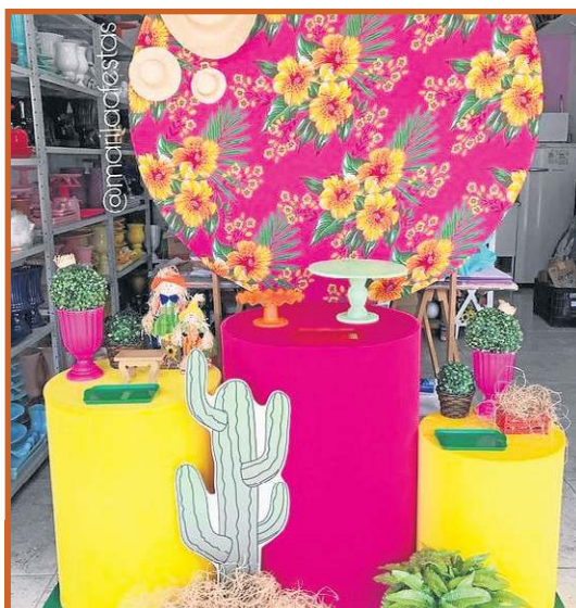
Uso de tecido e de papel crepom também é essencial na hora de enfeitar