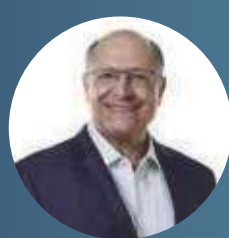
Geraldo Alckmin vice-presidente da República e ministro do Desenvolvimento, Indústria, Comércio e Serviços