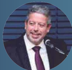
Arthur Lira presidente da Câmara Federal