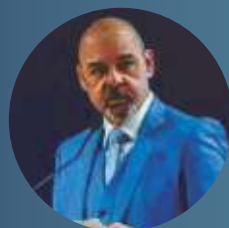
Vagner Freitas de Moraes presidente do Conselho Nacional do Sesi (CNSESI)