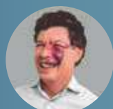
Reginaldo Lopes deputado e chefe do Grupo de Trabalho sobre Reforma Tributária