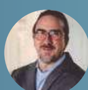
Bernard Appy secretário extraordinário da Reforma Tributária do Ministério da Fazenda