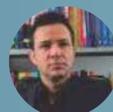
Uallace Moreira secretário de Desenvolvimento Industrial do Ministério da Indústria, Comércio e Serviços