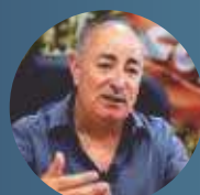
Sérgio Nobre presidente da Central Única dos Trabalhadores (CUT)