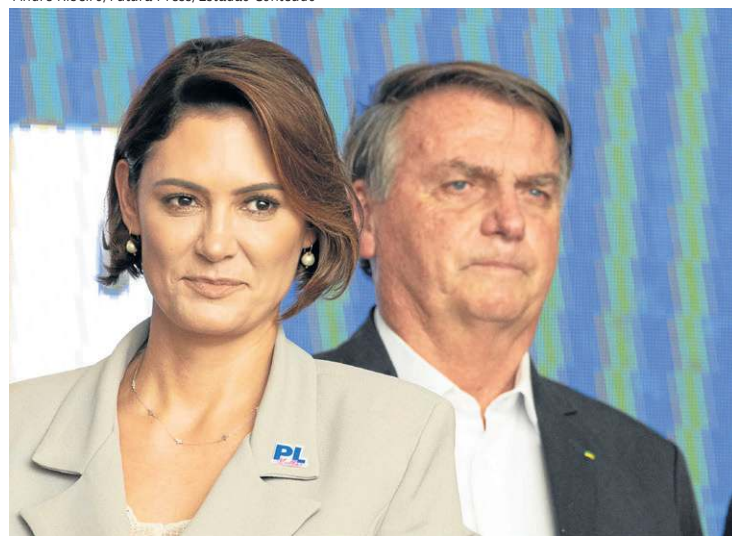
Michelle e Bolsonaro no evento do PL, na Assembleia Legislativa paulista