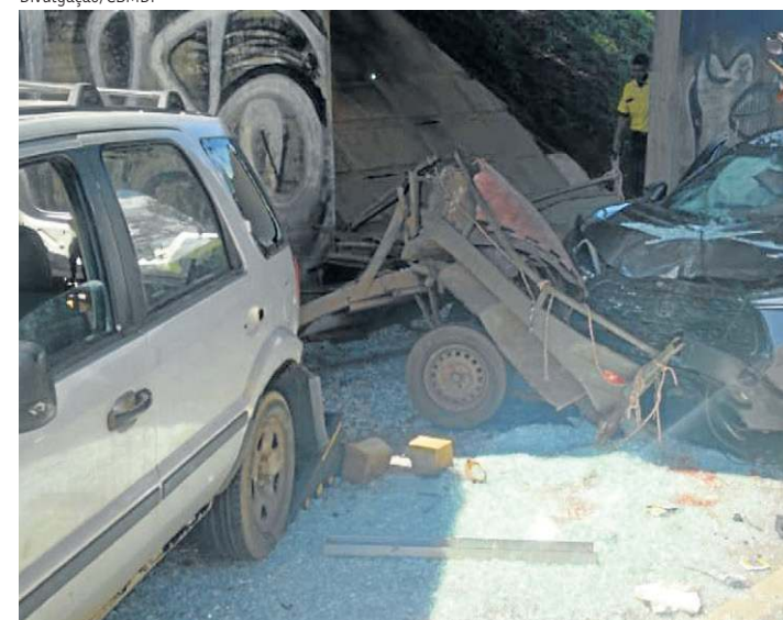
Dois homens foram prensados entre os dois automóveis, ontem