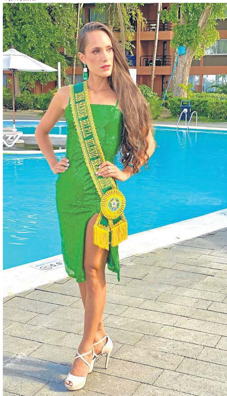
Policial militar disputou título com 21 mulheres do mundo, em abril

enorme. Quem me conhece, sabe quem eu sou. Eu falo que representei o meu estado em outro país. Muitos podem falar que o concurso não tem relação com a PM, mas na etapa da entrevista, por exemplo, foi completamente relacionada à profissão, algo que me orgulho. Querendo ou não, todos me olhavam como policial. É um orgulho imenso”, descreve.