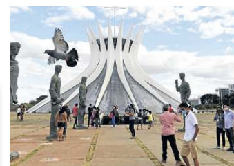
Minervino Júnior/CBDA Press

A Embratur, por sua vez, apresentou um estudo para embasar a viabilidade do remanejamento de recursos. Aponta que, a cada R$ 1 investido na promoção do turismo, R$ 20 são injetados na economia por meio do consumo dos visitantes. “É dinheiro que beneficia o trabalhador, o empresário e as cidades, que vão arrecadar mais”, frisou em comunicado oficial.