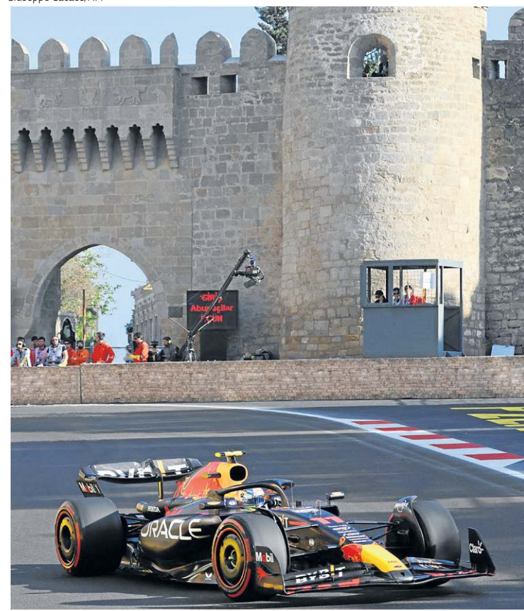
Piloto mexicano da Red Bull larga em terceiro, hoje, a partir das 8h

o grid. As posições da largada da corrida principal foram estabelecidas na sexta-feira. De qualquer forma, a corrida curta ainda conta pontos extras no Mundial. Vice-líder da classificação, Pérez soma oito e chega a 62, contra 75 do companheiro e líder Verstappen, que somou seis. Leclerc, vindo de resultados ruins, chega