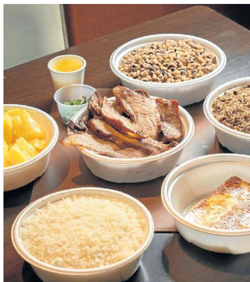
Carne de sol completa do Xique Xique