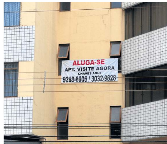
Ed Alves/GB/DA Press

Depois de o IPCA apresentar desaceleração, agora foi a vez do IGP-M, indicador conhecido principalmente por corrigir os contratos de locação, vir abaixo do esperado. Segundo a Fundação Getúlio Vargas (FGV), ele recuou 0,95% em abril após subir 0,05% em março. É importante lembrar que o mercado havia projetado queda menor, de 0,71%. Além disso, nos últimos 12 meses, o IGP-M encolheu 2,17% — é a primeira vez desde fevereiro de 2018 que a taxa em 12 meses fica negativa. Ou seja: a pressão para que o Banco Central reduza a taxa de juros ficará mais barulhenta ainda, embora seja consenso entre economistas que dificilmente a próxima reunião do Comitê de Política Monetária (Copom), marcada para a semana que vem, resultará na queda da Selic. Fato é que a economia brasileira permanece travada, e isso se deve, em boa medida, aos juros de 13,75% ao ano. Em um contexto desinflacionário, quanto tempo mais o BC manterá a taxa nas alturas?