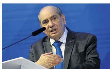
Marcelo Freixo/CB/D.A. Press

A CNC informou que “vai manter a efetividade das ações no Senado Federal, no sentido de preservação das entidades, assim como a atuação no Executivo, a depender do resultado da matéria no âmbito do Legislativo”. O presidente José Roberto Tadros levou o assunto pessoalmente ao presidente Lula para evitar a sanção.