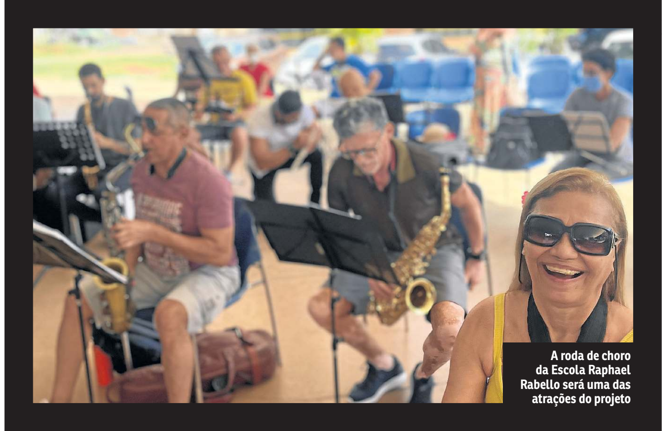
A roda de choro da Escola Raphael Rabello será uma das atrações do projeto

Para fechar a programação em clima de festa o público terá