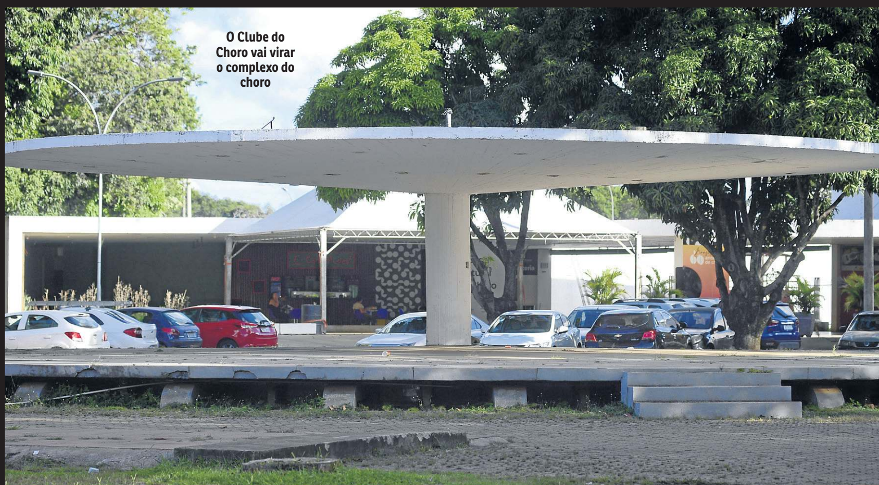
O Clube do Choro vai virar o complexo do choro

PROJETO FINANCIADO PELA SHELL PROMOVERÁ UMA PROGRAMAÇÃO AMPLA, COM OITO MESES DE DURAÇÃO, NA ÁREA ONDE ESTÁ INSTALADO O CLUBE DO CHORO