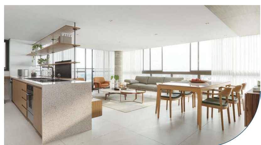
Perspectiva sala e cozinha | apartamento tipo de canto