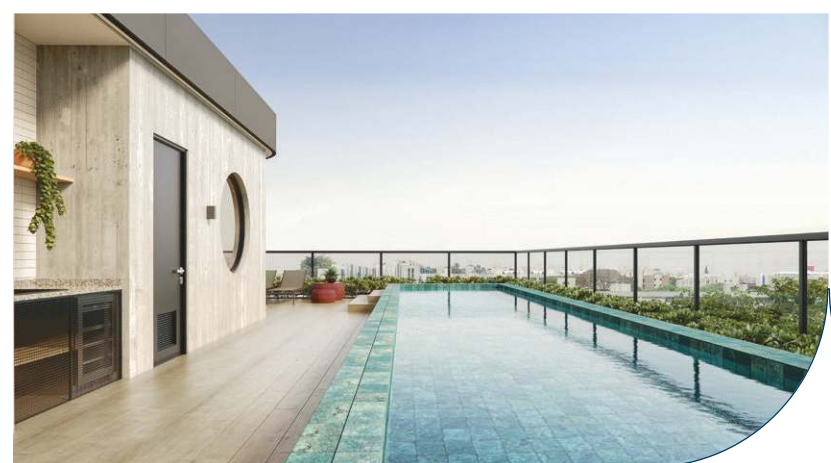
Perspectiva piscina | cobertura coletiva