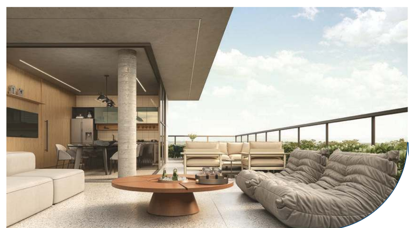
Perspectiva espaço gourmet e terraço integrados | cobertura coletiva