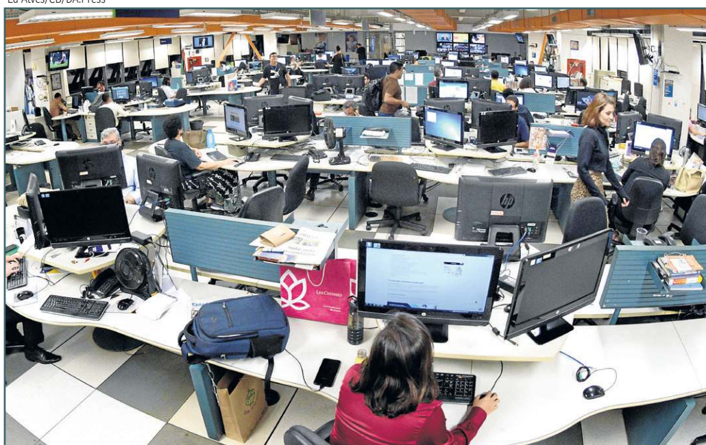
A redação do Correio reúne repórteres que atuam nas diversas plataformas do jornal