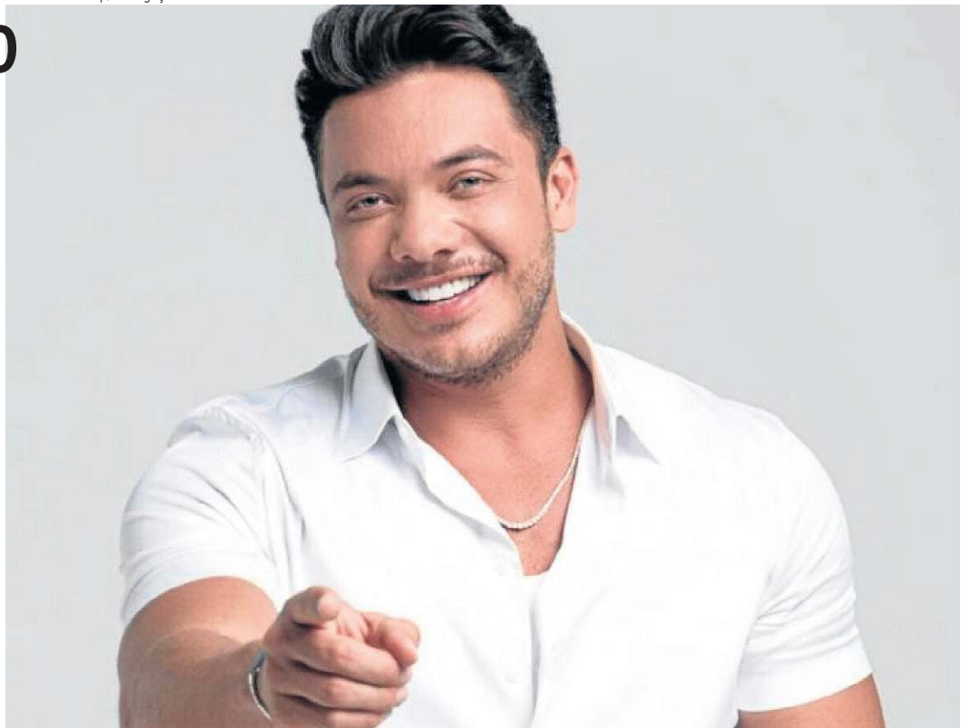
Wesley Safadão comanda o festival Garota Vip hoje, na Arena Mané Garrincha