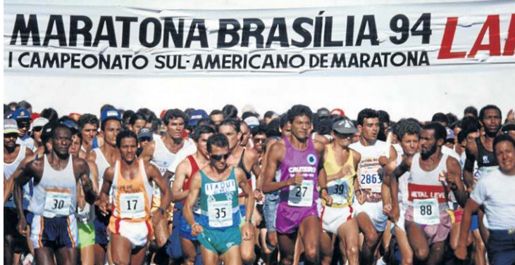
Em 1994, milhares de corredores lotaram as ruas de Brasília

ritmo nordestino e, como não poderia faltar, e rock para animar os participantes.