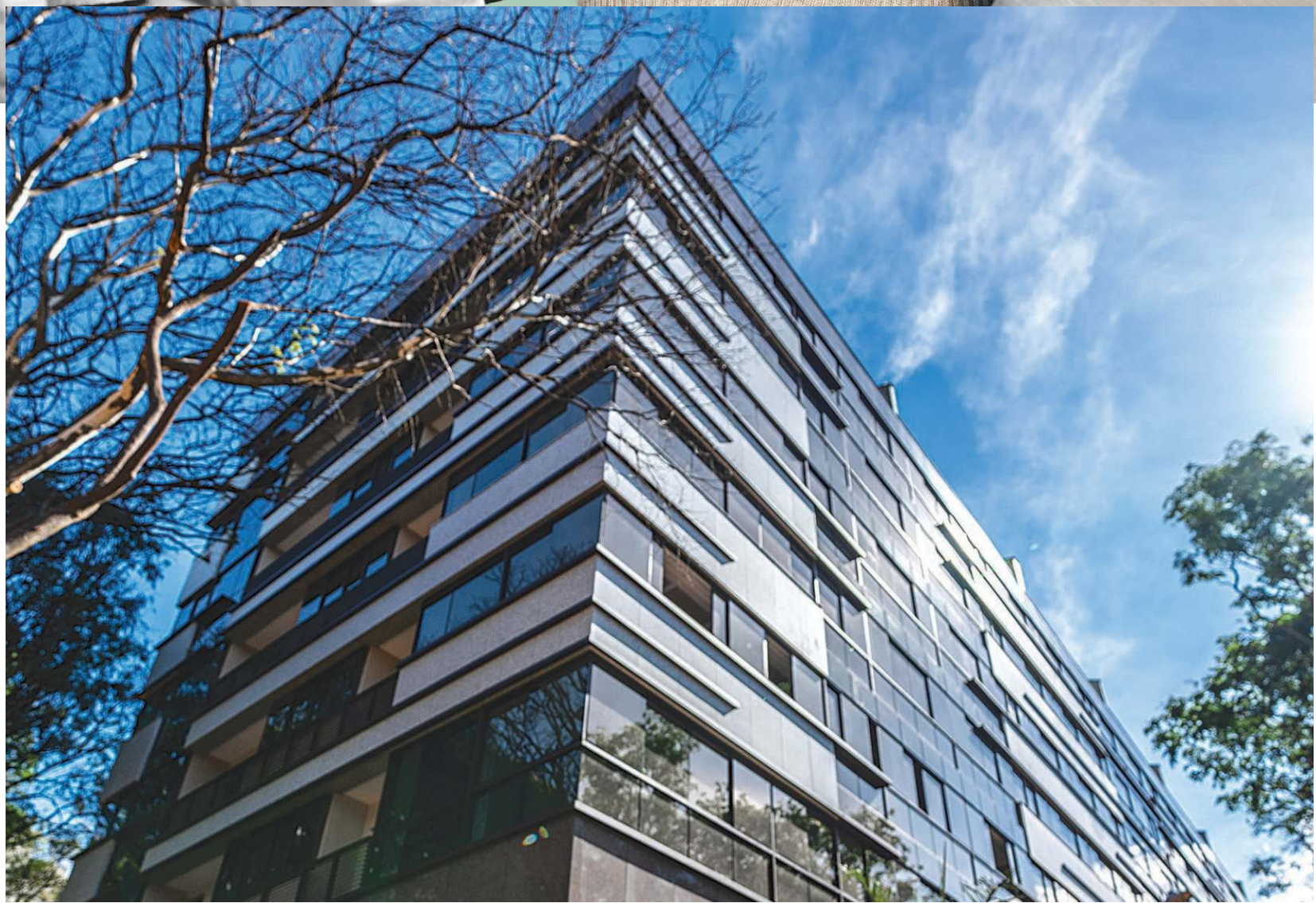
2º Ofício RI.4 M.4589