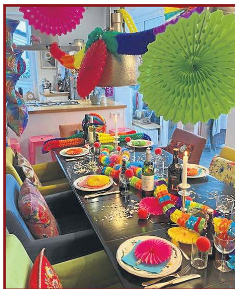
Na hora de reunir familiares e amigos, o importante é não ter medo de ousar e querer curtir o carnaval com quem se ama