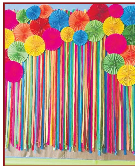
Fitas e objetos coloridos são elementos fundamentais para a decoração de carnaval