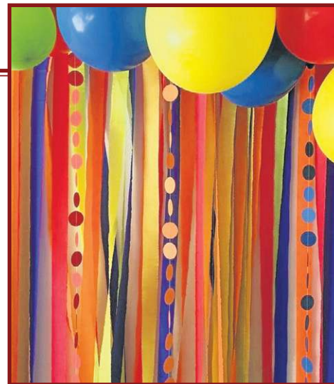
Balões e fitas são uma boa pedida para deixar o local mais colorido