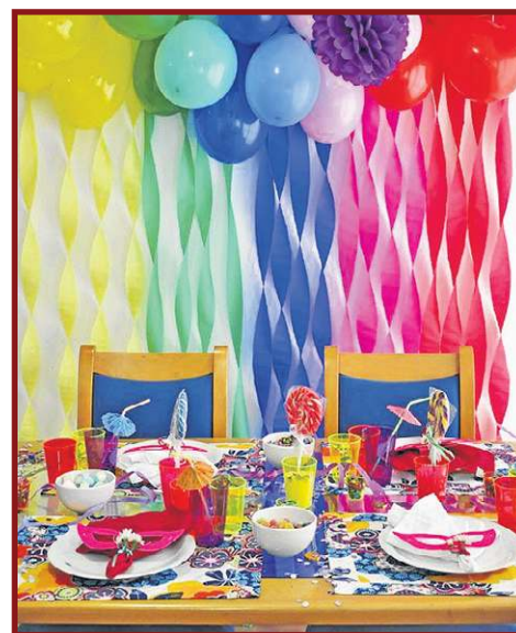
Paredes da cozinha podem ser ornamentadas para deixar o clima ainda mais alegre