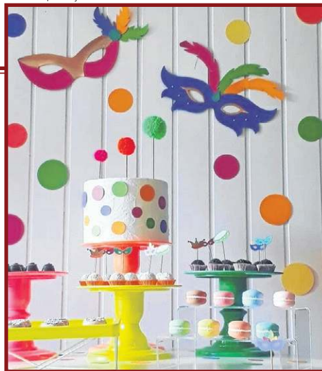
Máscaras podem ser usadas na parede para compor o cenário carnavalesco