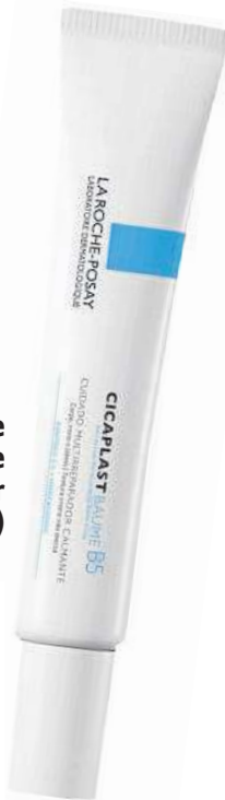
Cicaplast baume B5 La Roche Posay (a partir de R$ 31,90)