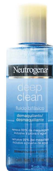
Neutrogena deep clean bifásico (a partir de R$ 35,45)