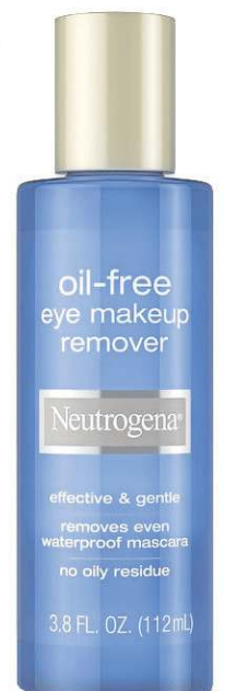
Eye make up remover oil free Neutrogena (a partir de R$ 303,06)