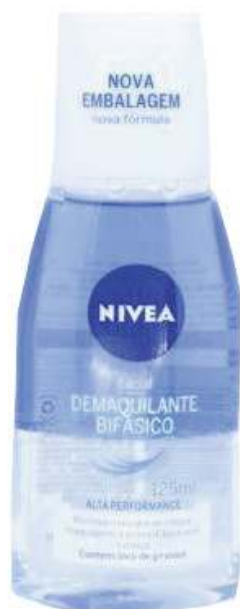
Demaquilante de olhos visage Nivea (partir de R$ 27,99)