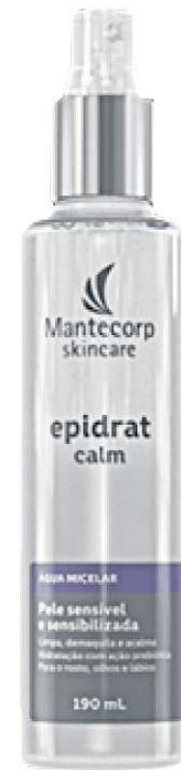
Epidrat Hyalu (a partir de R$ 85,49)