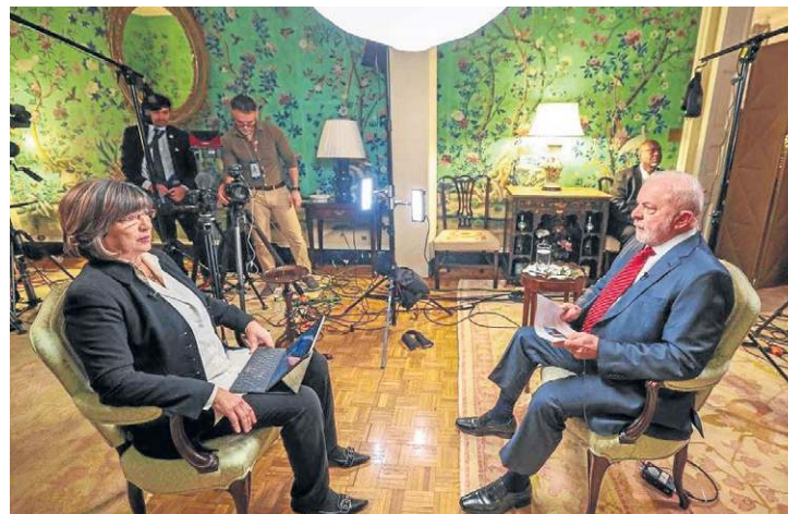
Lula na entrevista: extradição de Bolsonaro depende da Justiça brasileira

vai ter mais. Acho que ele, em algum momento, vai ser condenado em alguma corte internacional sobre a questão do genocídio devido à covid, porque metade