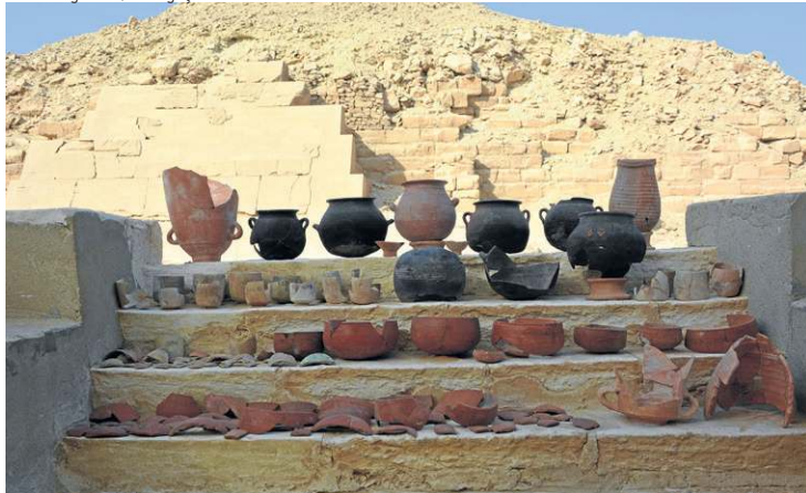
Recipientes de barro estavam em uma câmara subterrânea perto da pirâmide de Unas e continham informações sobre como usar os produtos

múmias. Nenhum dos métodos, porém, era preciso. Muitas vezes, as instruções nos hieróglifos se resumiam a nominar os químicos como “óleo” ou “resina”, o que diz muito pouco sobre sua composição. Por outro lado, ao extrair as informações diretamente dos corpos embalsamados, corre-se o risco de as amostras estarem contaminadas por outras substâncias.