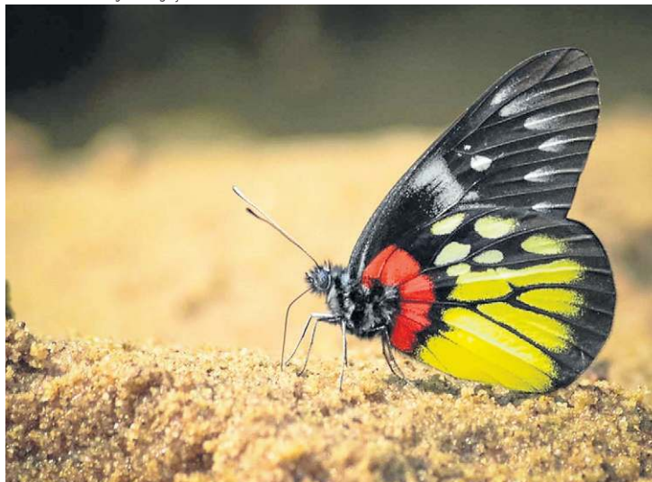
Mesmo em áreas de conservação, a borboleta Delias pasithoe está em risco

representadas em áreas de conservação, incluindo vários criticamente ameaçados, como a formiga dinossauro, a libelinha havaiana carmesim e a mariposa-tigre. Além disso, as distribuições globais de 1.876 espécies de 225 famílias não estão protegidas.