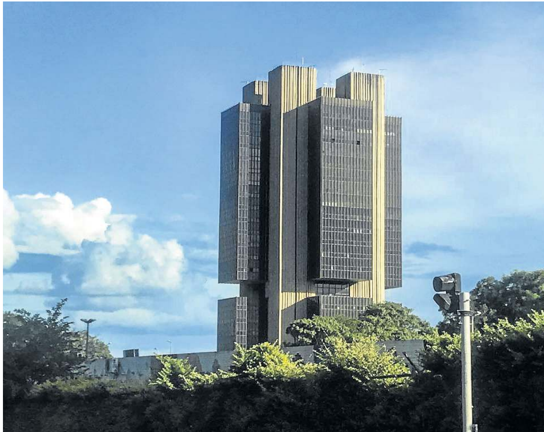
Em comunicado, Banco Central afirma que não hesitará em elevar a taxa, caso seja necessário

sobre a possibilidade de elevar a meta de inflação. De 11,25% em novembro, a previsão avançou para 12,50% nesta semana. Estudo do Itaú Unibanco alertou para