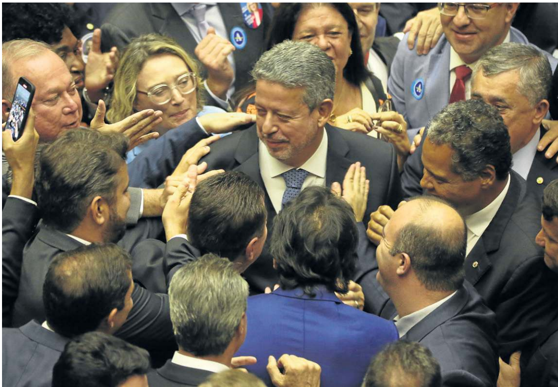
Arthur Lira recebe os cumprimentos de parlamentares: em 2021, o deputado obteve 302 votos