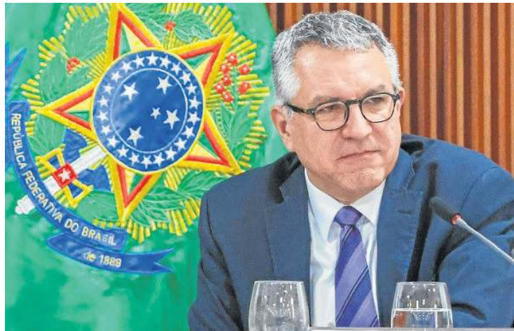
Padilha: “A era de conflito, de guerra entre governo e Congresso, acabou”

A reeleição de Arthur Lira (PP-AL) para a presidência da Câmara e de Rodrigo Pacheco (PSD-MG) para o comando do Senado, já esperada pelo Palácio do Planalto, provocou uma sensação de alívio no governo de Luiz Inácio Lula da Silva (PT). Políticos que participaram intensamente das articulações no Congresso para viabilizar a recondução dos presidentes das duas Casas consideram que foi desmontado, ontem, um dos principais focos da crise política pela qual passa o país desde o impeachment da presidente Dilma Rousseff: a divisão do Parlamento entre dois grupos antagônicos, com a captura da maioria pelo projeto de poder do então presidente Jair Bolsonaro (PL).