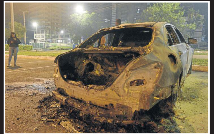
Um rastro de destruição: veículos queimados por vândalos na região central da cidade, que completou 35 anos como Patrimônio Histórico e Cultural da Humanidade