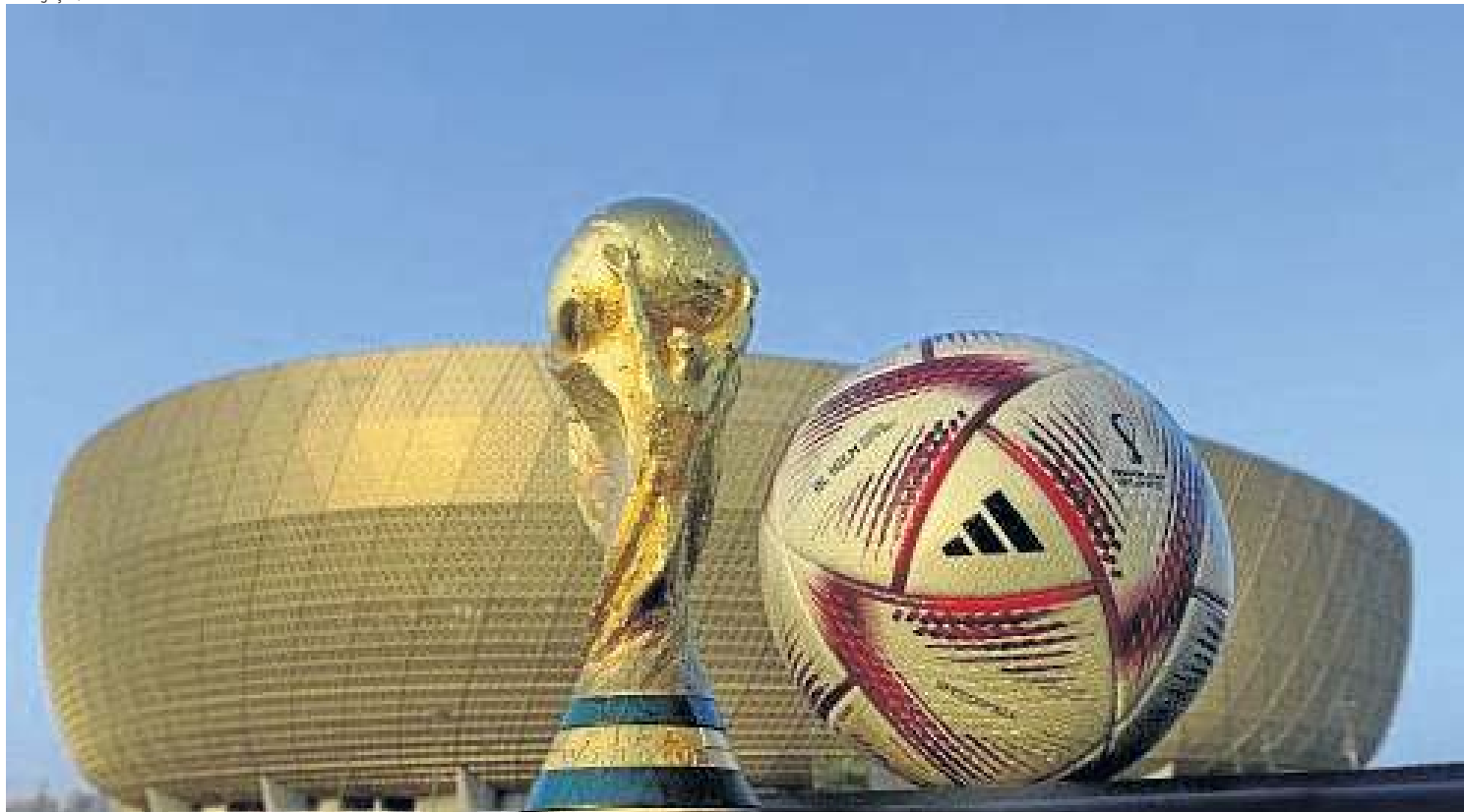
Recheada de tecnologia, Al Hilm foi projetada para homenagear a taça do Mundial e o padrão da bandeira do Catar, país-sede do torneio em 2022

impacto para serem combinados com o rastreamento dos jogadores feito por 12 câmeras montadas no teto dos estádios.