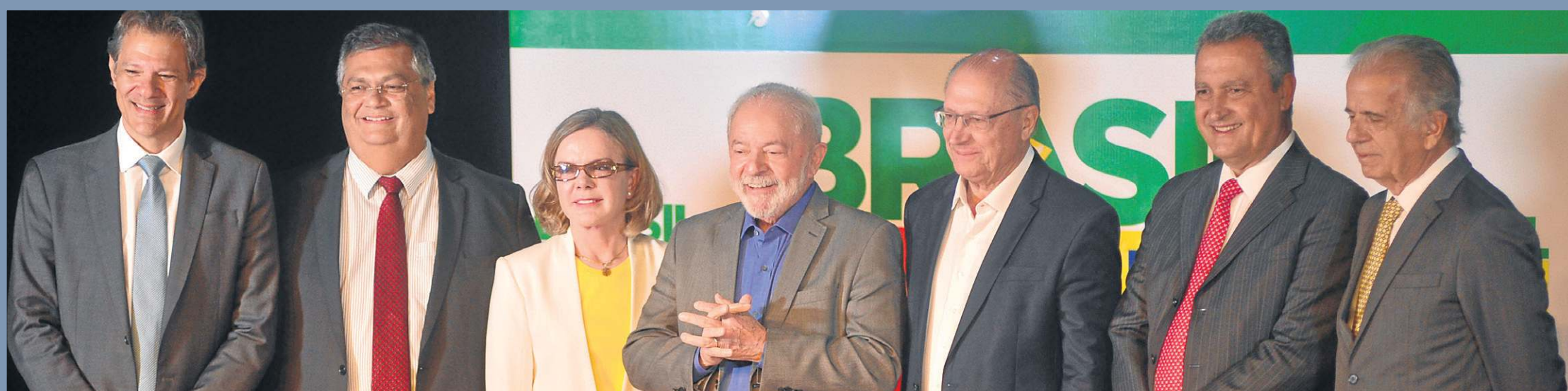
Fernando Haddad, Flávio Dino, Gleisi Hoffmann, Lula, Geraldo Alckmin, Rui Costa e José Múcio: primeiro anúncio de ministros no CCBB. O futuro chanceler Mauro Vieira está na Croácia