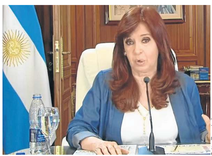
Cristina Fernández de Kirchner se pronuncia a partir do próprio gabinete no Senado: "Não serei candidata a nada em 2023"

nome não estará em nenhuma cédula. Terminou em 10 de dezembro e regresso (...) para minha casa", assegurou. Mesmo assim, tratou de criticar a condenação de inabilitação política. "Todos os cargos que ocupei foram por meio de eleição popular. Quatro governos em nome do peronismo."