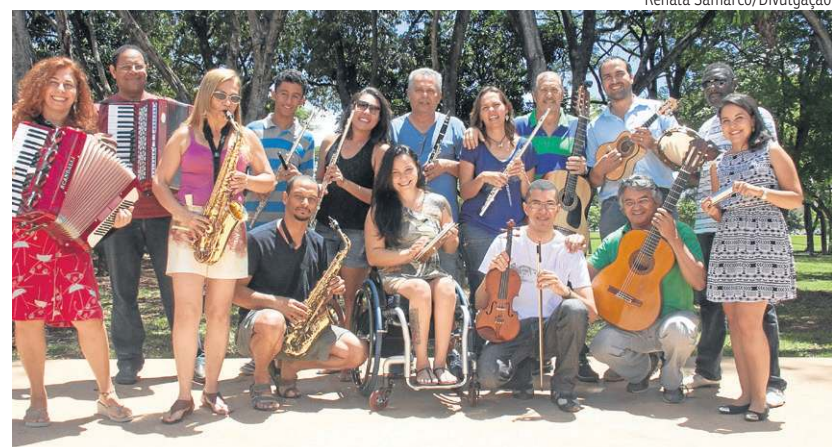
Show de alunos da Escola de Choro Raphael Rabello