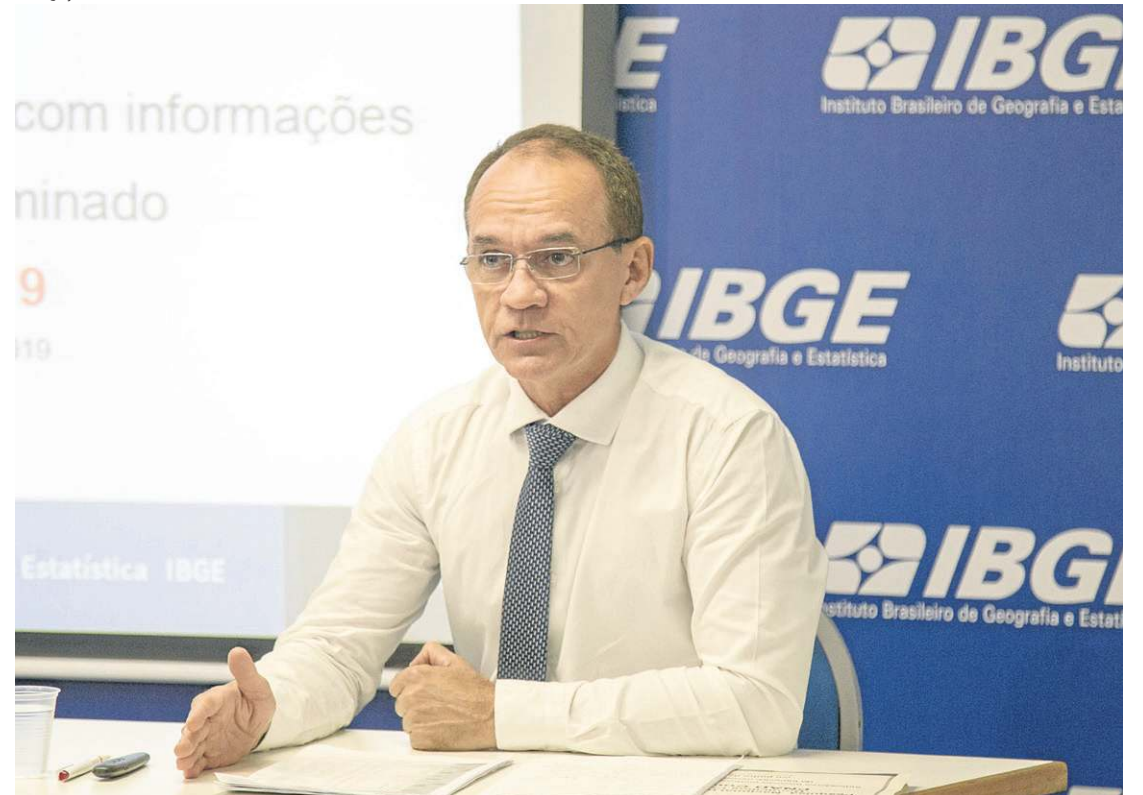
Cimar disse que há estados em que o levantamento de dados precisa avançar mais, como Mato Grosso e Amapá

“A gente tinha expectativa de entregar preliminares do Censo. Para os municípios que a fecharam, a gente vai conseguir fazer essa entrega. Para os que não fecharam, o IBGE vai fazer uma espécie de