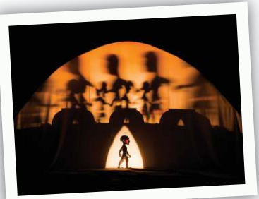
Iara, o encanto das águas é uma obra da Cia Lumiato