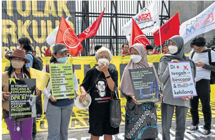
Ativistas protestam contra novas leis diante do Parlamento, em Jacarta

o casamento entre pessoas do mesmo sexo não é autorizado.