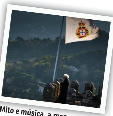
Mito e música, a mensagem de Fernando Pessoa: sintonia entre Portugal e Brasil

Festival Internacional Cinema e Transcendência aproxima cinéfilos e culto da arte do Brasil profundo, propondo amplo panorama que mistura música, literatura e expressões populares