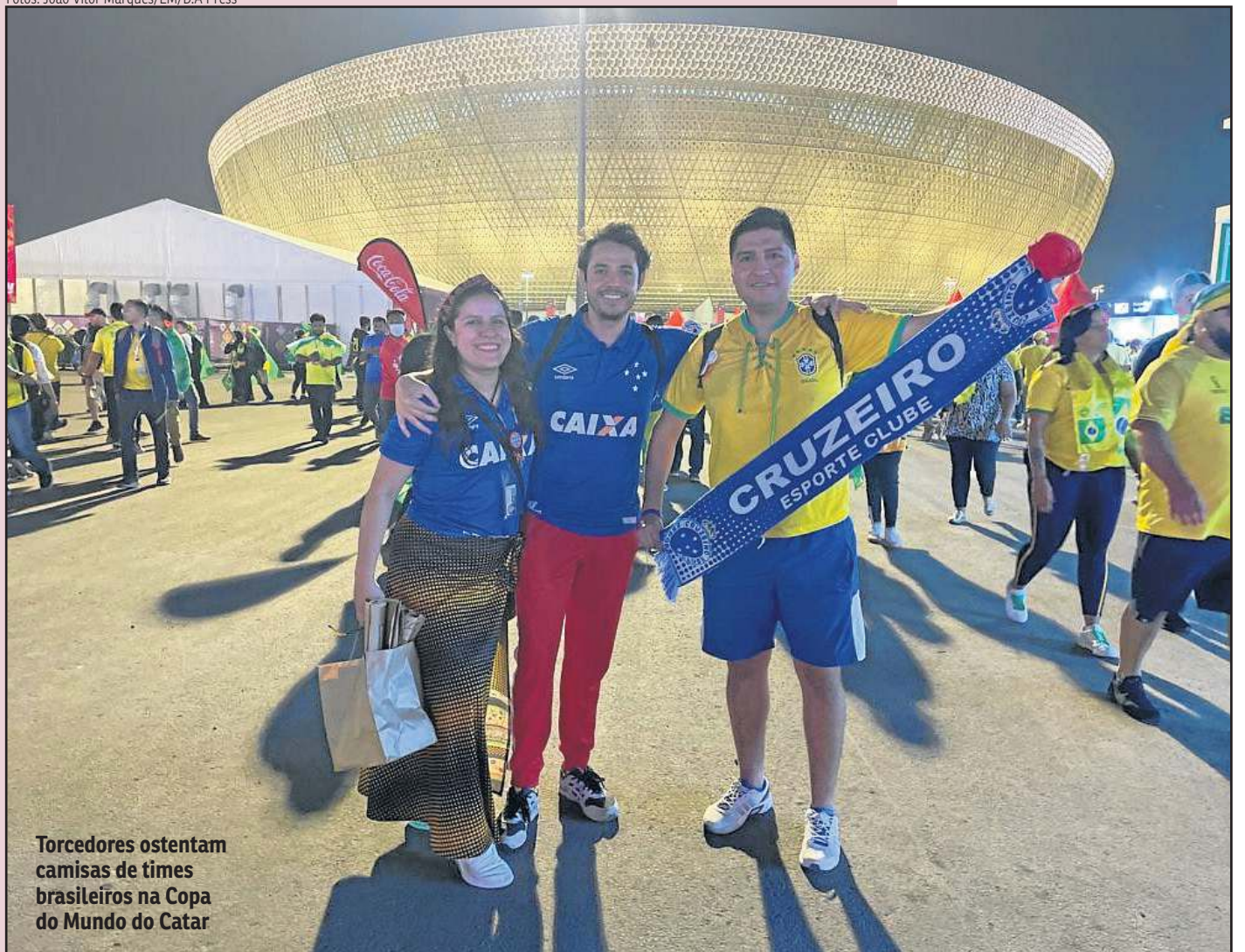
Torcedores ostentam camisas de times brasileiros na Copa do Mundo do Catar