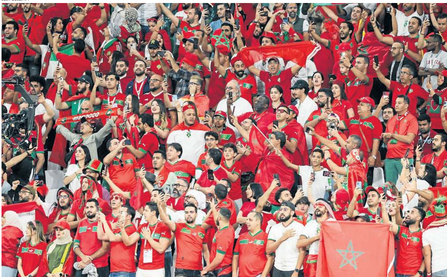
Torcida do país africano incentivou bastante durante os 90 minutos e comemorou a inédita classificação às quartas de final da Copa do Mundo

“O sonho. Sempre falei isso aos meus jogadores. É preciso ter energia, amor. Com isso, ganhamos o jogo. Vamos descansar antes de pensar no próximo adversário”