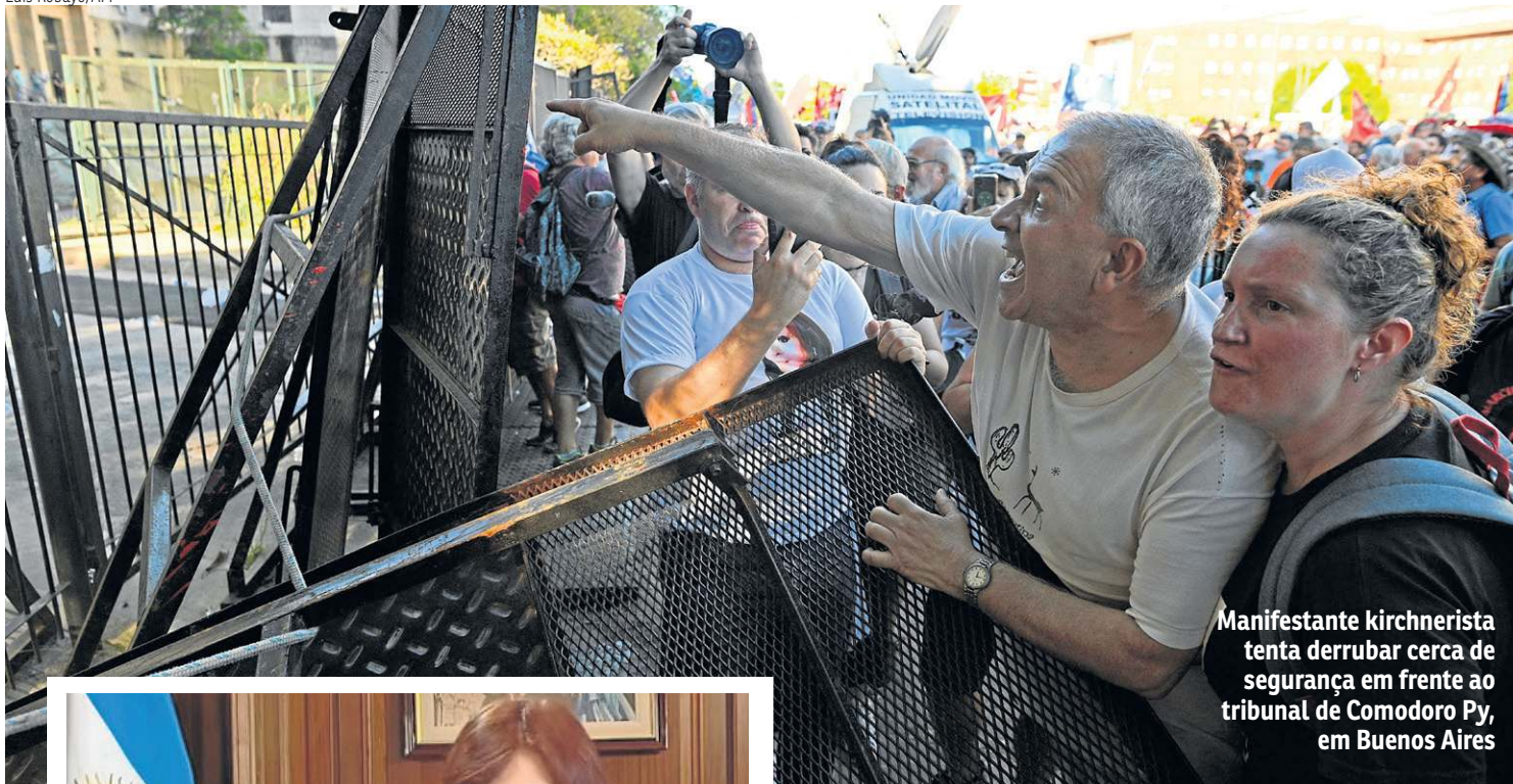
Manifestante kirchnerista tenta derrubar cerca de segurança em frente ao tribunal de Comodoro Py, em Buenos Aires