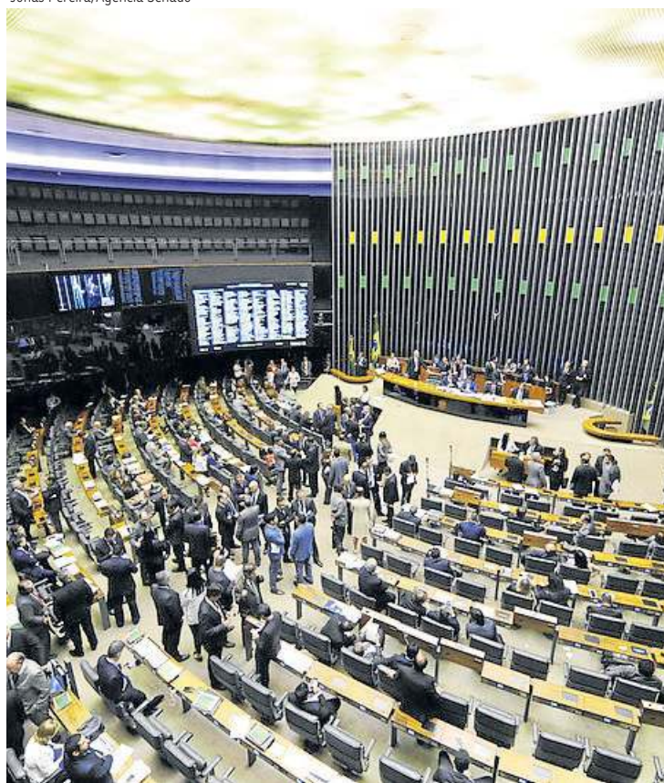
Com o Orçamento desafogado, as RP-9 podem ser desbloqueadas