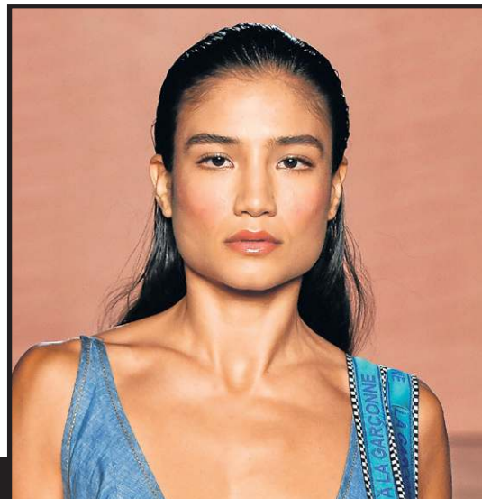
Cabelos com aspecto molhado e penteados para trás no desfile da A La Garçonne