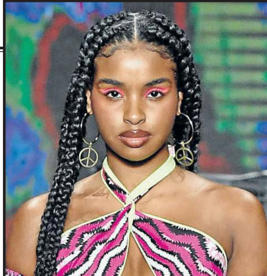
No desfile da Meninos Rei, os fios divididos ao meio apareceram junto com uma maquiagem chamativa e com cores fortes