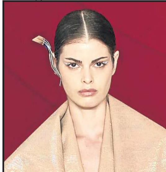
Lenny Niemeyer apostou nos cabelos divididos e maquiagem com destaque para os olhos brilhantes