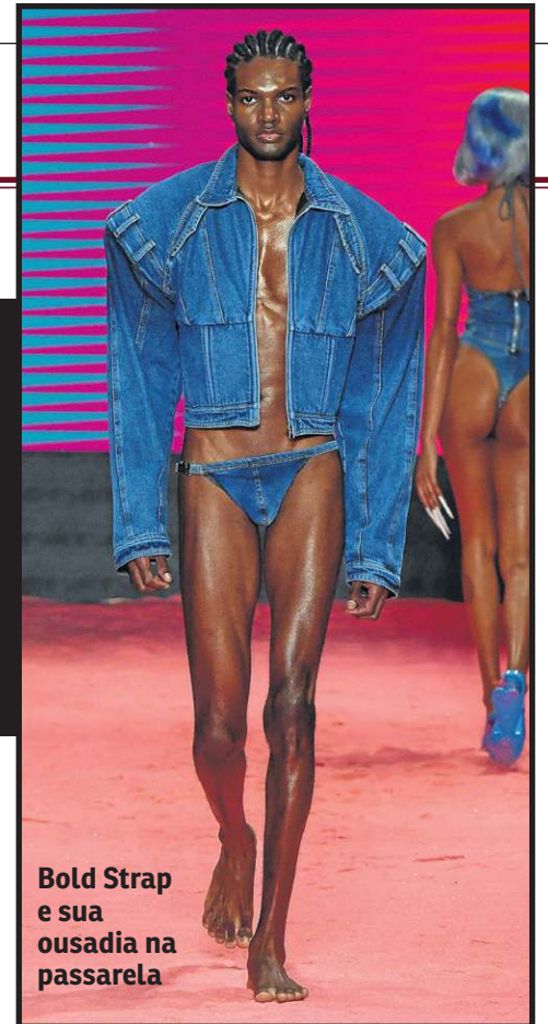
Bold Strap e sua ousadia na passarela

Aumentando a lista de tendências trazidas nas passarelas, a ancestralidade, tema já trabalhado anteriormente por algumas marcas, apareceu com força e trazendo heranças da cultura negra, indígena e brasileira.