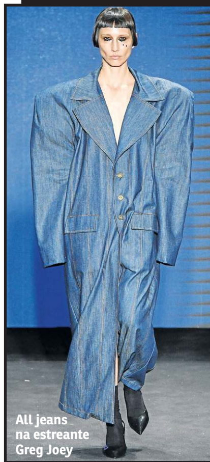
All jeans na estreada Greg Joey

A moda Y2K, inspirada no início do milênio, veio com tudo e trouxe releituras de looks "all jeans" e das inesquecíveis e atemporais minissaias. Embora não tão querida e alvo de muitas críticas, as calças de cintura baixa também fizeram o seu come back, inclusive nos corpos masculinos.