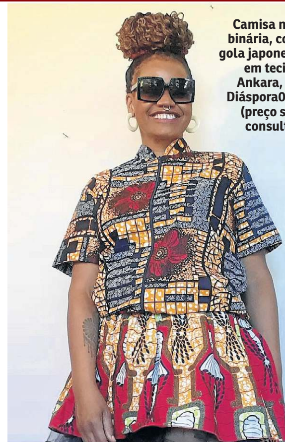
Camisa não binária, com gola japonesa em tecido Ankara, na Diáspora009 (preço sob consulta)