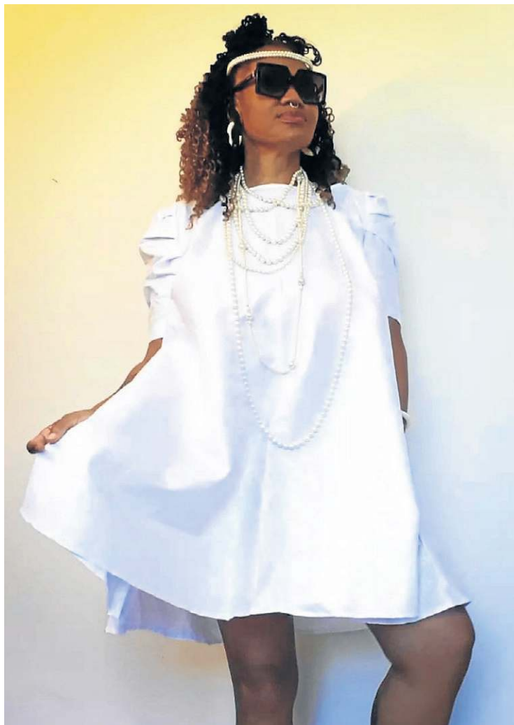
Vestido branco, na Diáspora009 (preço sob consulta)